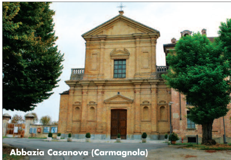
Abbazia Casanova (Carmagnola)

della Chiesa Cattolica, guidata dal Papa e dai Vescovi; obbedienza al Papa e ai Vescovi, di cui è portavoce all'interno del gruppo il sacerdote direttore spirituale nominato dal Vescovo; preghiera con la Chiesa, per la Chiesa e nella Chiesa, con la partecipazione attiva alla vita liturgica.