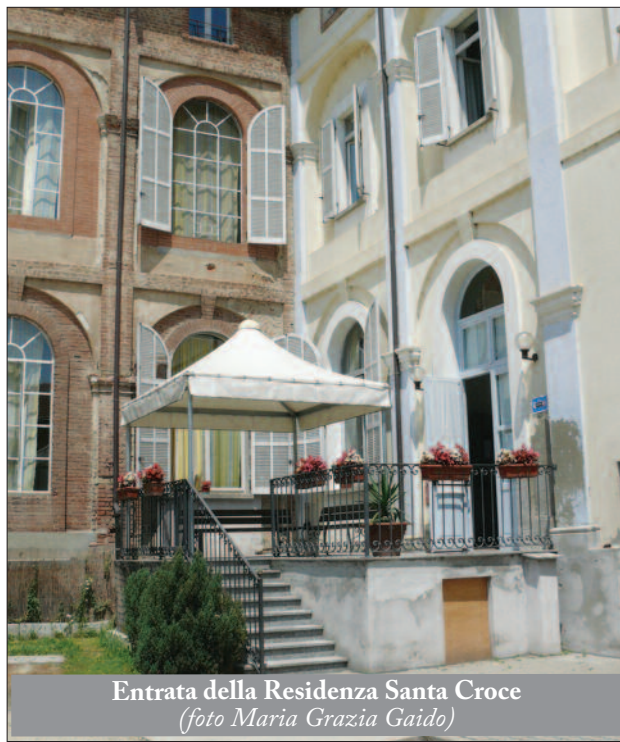
Entrata della Residenza Santa Croce

Le letture e l'omelia sono seguite con grande attenzione e chi ha più problemi di udito si colloca per questo più vicino a me. Dopo la preghiera dei fedeli, trascorriamo qualche minuto di raccoglimento in adorazione del pane eucaristico, prima di recitare il Padre nostro e